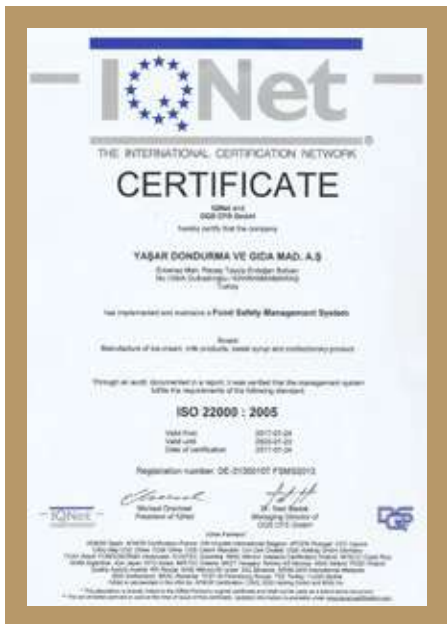
DQS KALİTE BELGESİ DQS QUALITY DOCUMENT DQS شهادة الجودة