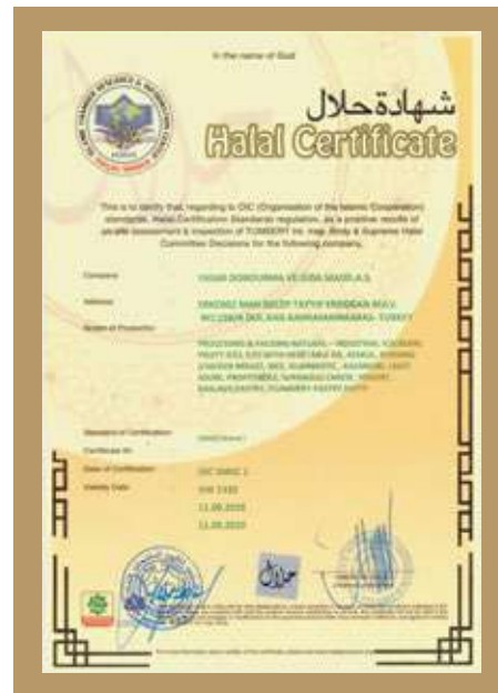
HELAL SERTİFİKASI CERTIFICATE OF HALAL شهادة حلال