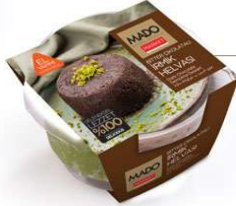
Bitter Çikolatalı İrmik Helvası Dark Chocolate Semolina Dessert حلوى السميد ب شوكولاتة داكنة 200g