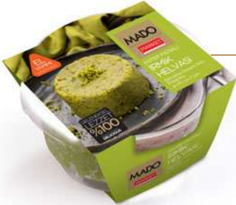
Fıstıklı İrmik Helvası Semolina Dessert with Pistachio حلوى السميد بالفستق 200g