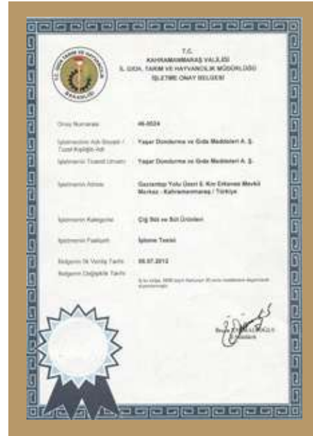
İŞLETME ONAY BELGESİ OPERATION PERMIT CERTIFICATE شهادة الموافقة التجارية