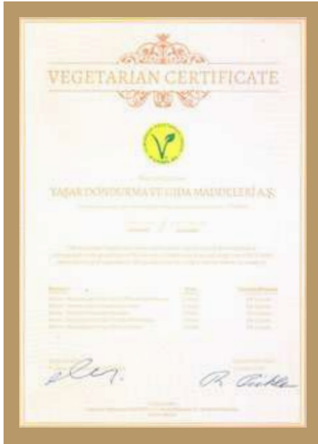
VEGAN SERTİFİKASI VEGAN CERTIFICATE شهادة نباتية