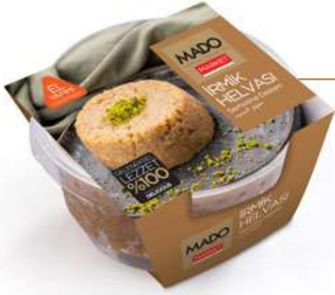
İrmik Helvası Semolina Dessert حلوى السميد 200g